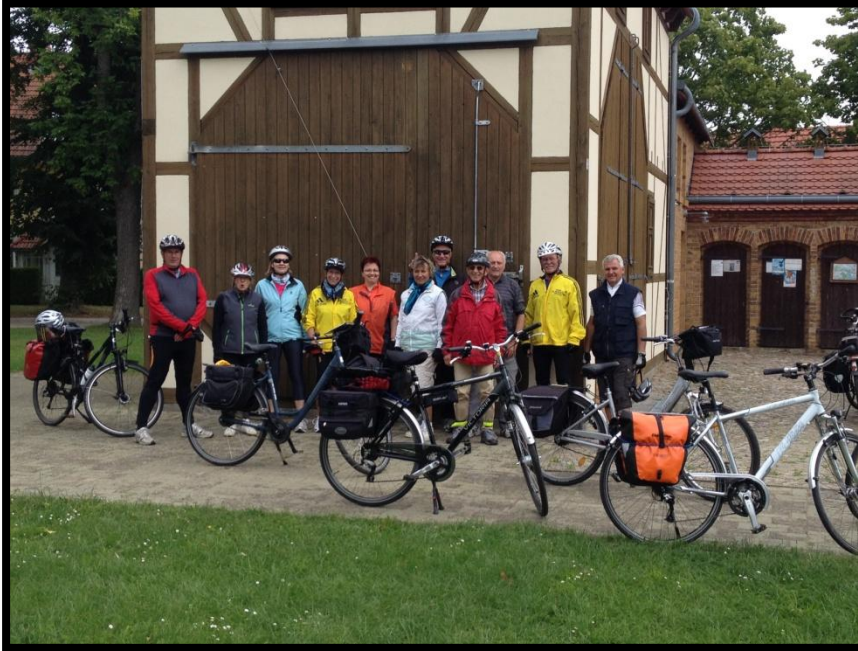
Auf dem Fernradweg von Berlin nach Leipzig im August 2014