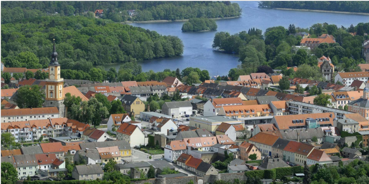
Blick auf Templin

Die Teilnehmer haben für ihren Versicherungsschutz selbst zu sorgen. Die Tourenleitung sowie der SSV Lichtenrade übernehmen keinerlei Haftung.