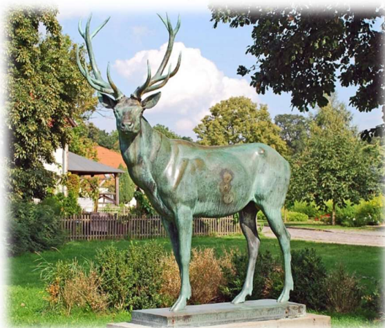
Bronzehirsch in Hirschfelde (Amerika)

Die Teilnehmer haben für ihren Versicherungsschutz selbst zu sorgen. Die Tourenleitung sowie der SSV Lichtenrade übernehmen keinerlei Haftung.