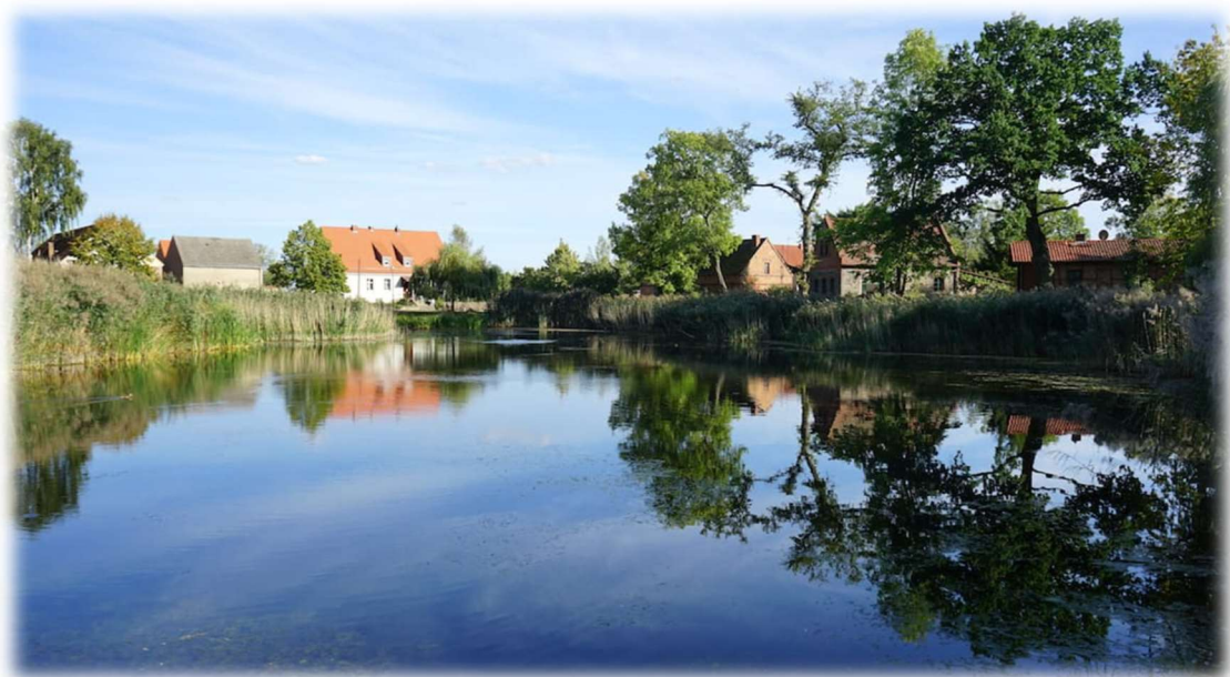
Dorfteich Ihlow

Die Teilnehmer haben für ihren Versicherungsschutz selbst zu sorgen. Die Tourenleitung sowie der SSV Lichtenrade übernehmen keinerlei Haftung.